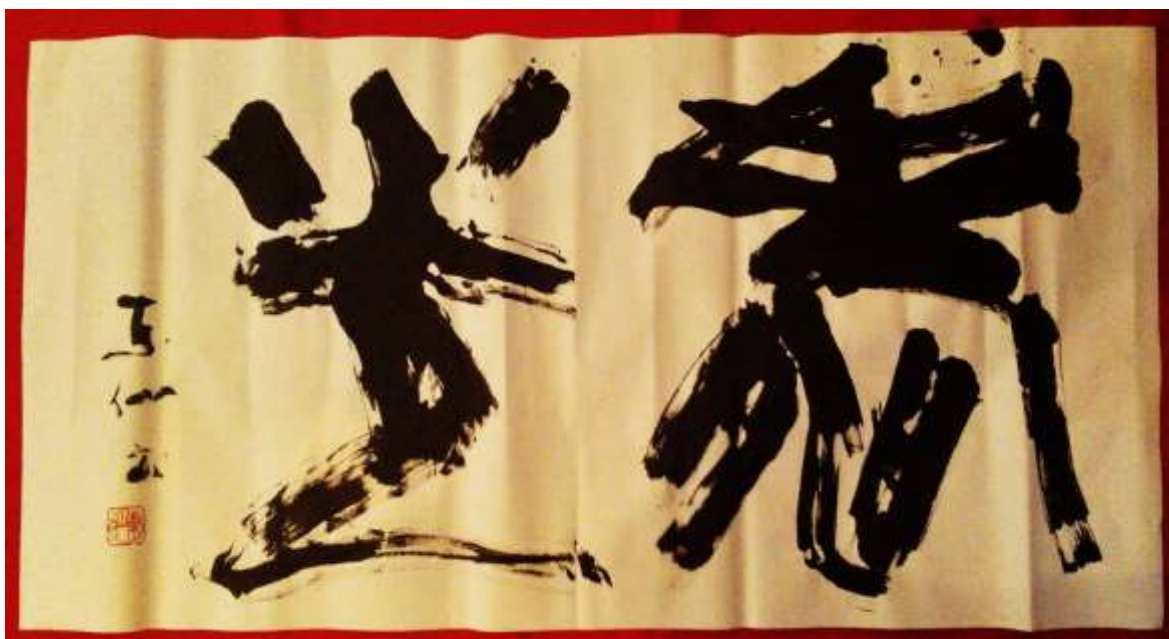
Kaligrafie (dlouhý život-světlo) vytvořil mistr USUDA