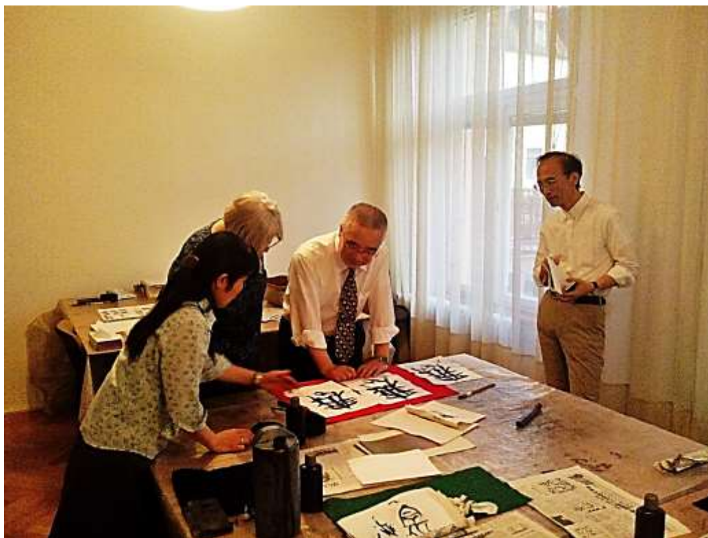
Foto z kaligrafické dílny